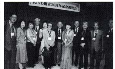
KIND創立20周年の祝賀会に参加