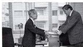
渋谷区長より感謝状