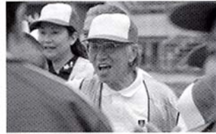
閉会式 よくがんばった