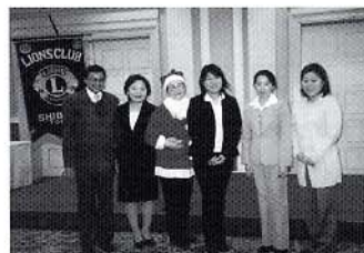
クリスマス例会に留学生の皆さんをお招きして