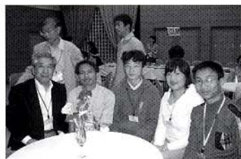
東南アジアからこられた留学生の皆さんと一枚