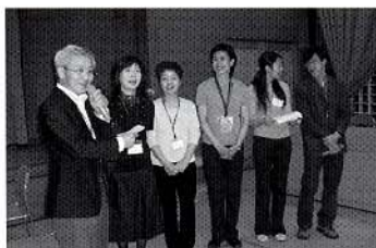
ウェルカムパーティーにてKINDの岩倉会長以下おかあさん達