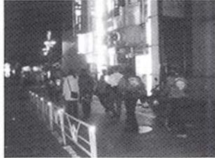
渋谷の繁華街を夜警

日本ガーディアン・エンジェルスは、ボランティアで犯罪防止活動をする NPO(民間非営利組織)です。