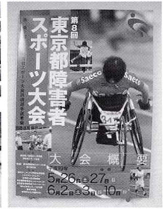
当日のプログラム