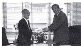
渋谷区長へ目録贈呈